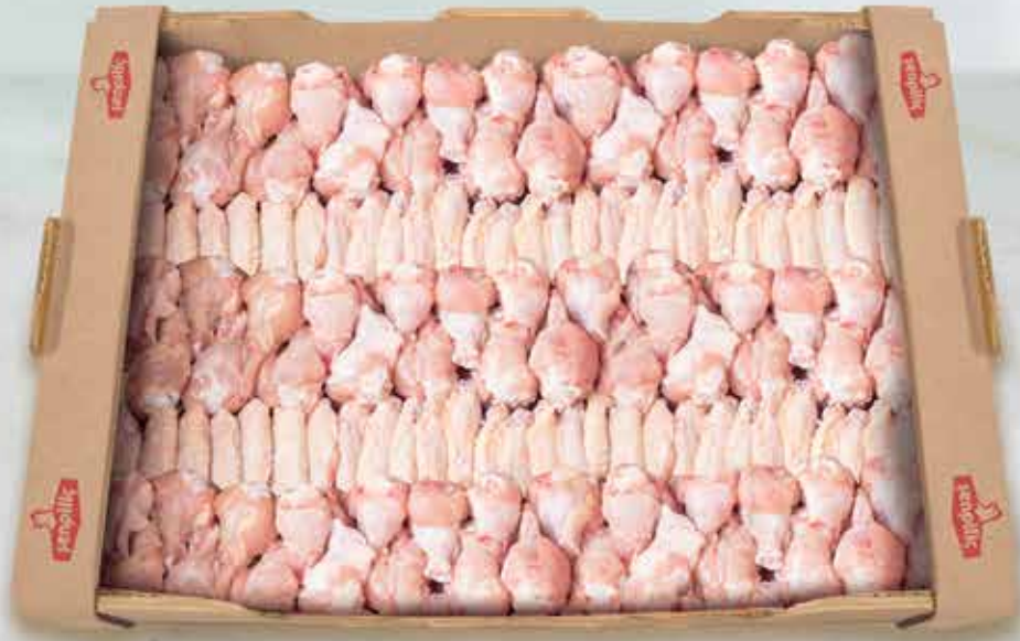
Karışık Izgaralık Kanat