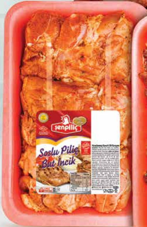
Soslu But İncik