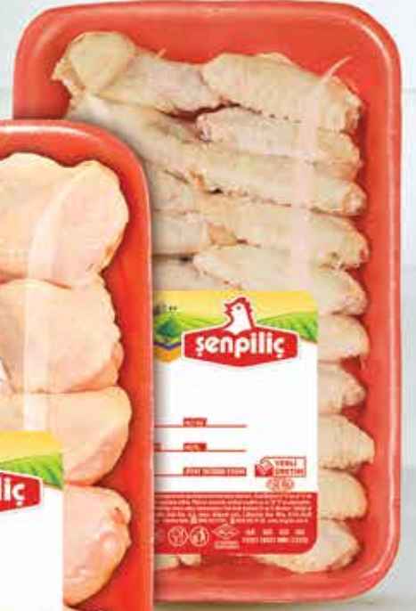
Karışık Izgaralık Kanat