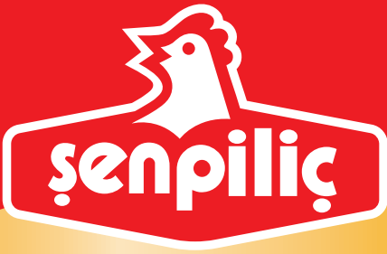
Acılı Kanat İncik