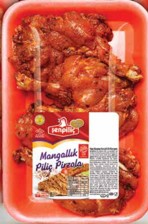
Mangallık Derili Pirzola